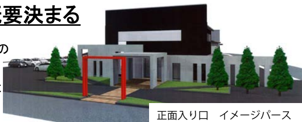
正面入り口 イメージパース

SUWADA はこの秋、工場の全面オープンファクトリー化を実現します。お客様には左図のように第三工場正面入り口からお入りいただき本社工場、第二工場をぐるりと見学いただける通路を設けます。工場内は全て黒で統一され、省電力の LED 照明を全箇所に採用。重厚感あふれる空間の中、SUWADA の商品や会社の歴史等のパネル展示ギャラリーを通り抜け、実際の作業現場をご覧いただけます。ガラス越しに職人の作業を見ながら、お客様も自ら備え付けのカメラを操作して、熟練職人の手元をズームアップしてご覧いただく予定です。